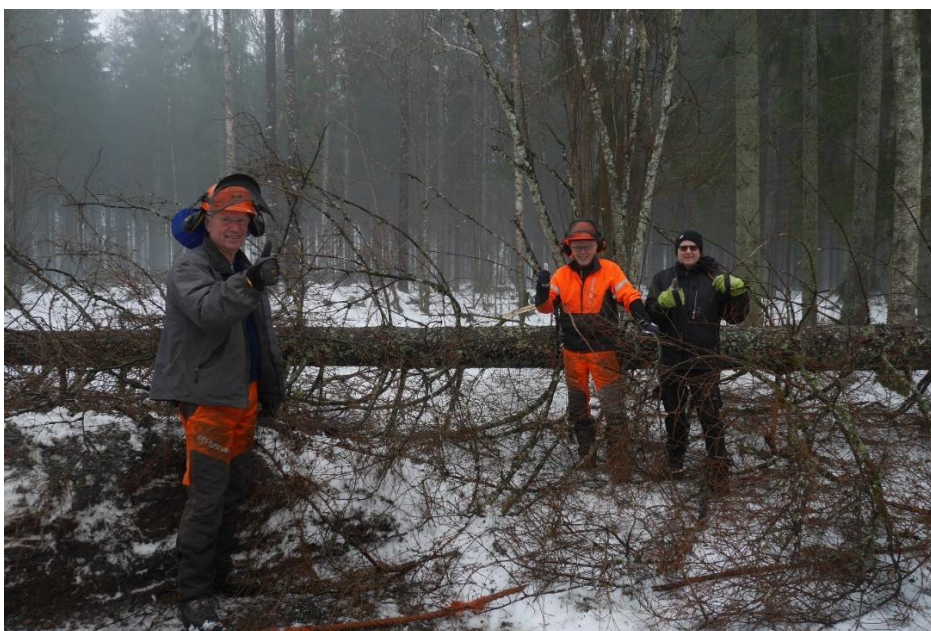
Tre nöjda skogsarbetare – ett resultat av gott samarbete