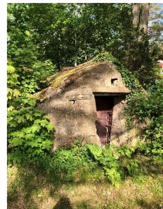
Väldigt gammal jordkällare