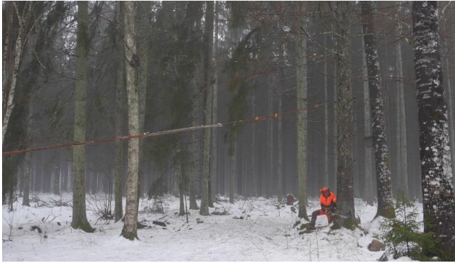
Ulf börjar såga