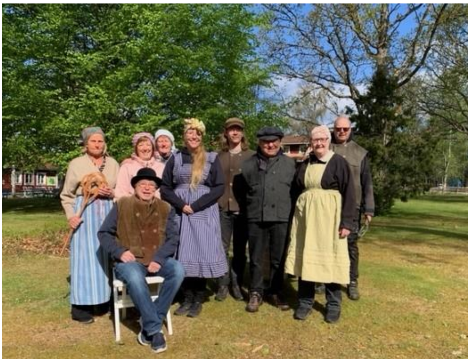
Här är en bild på alla vuxna som var med. Alla är fint utklädda – som komna från 1800-talet!

Pedagogerna från länsmuseet var fantastiskt duktiga, de fick verkligen igång barnen. Vår förening fick ett mycket fint tackbrev från barnen på förskolan Solgläntan. De tyckte att de hade haft roligt.