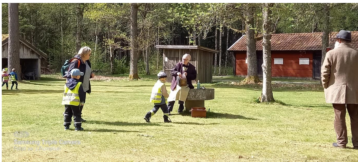
Nedan syns hur barnen springer och troligen letar ägg eller kanske de bara springer omkring och leker i det vackra vädret.